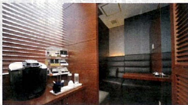
人間ドッグの待合室は、木目調で落ち着いた雰囲気