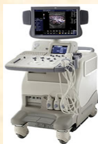
超音波検査 エコー